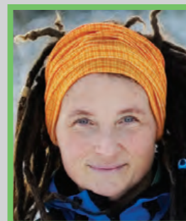
Cecilia Hed Malmström

Ät aldrig mangan hel - fyra tumregler för god personlig struktur